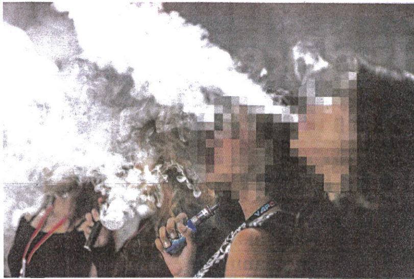
PENGHISAP vape tegar perlu memastikan bahan-bahan yang digunakan dalam rokok elektronik dijalin selamat. - GAMBAR HIASAN

“Kajian dinamakan Incidence of Evali among SARI Patients ini telah mendapati, insiden Evali adalah sebanyak 840 kes dalam 100,000 kes SARI (Jangkitan Pernafasan Akut Teruk).