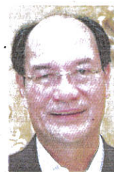
Datuk Gerawat Gala

"With the economic recovery from the Covid-19 pandemic,