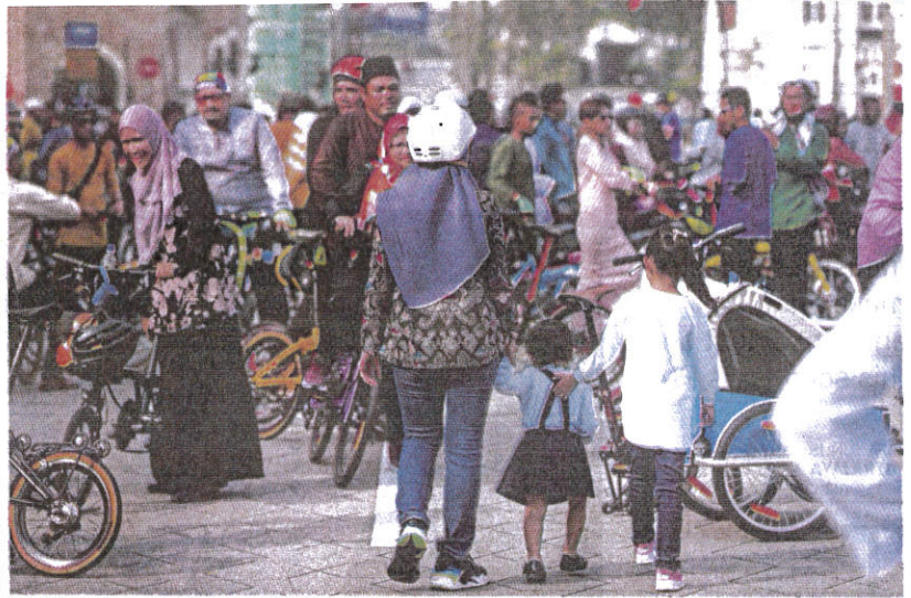
People participating in outdoor activities at Dataran Merdeka in Kuala Lumpur on Sunday.